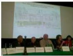
Konferencja w Wytwórni Filmów Dokumentalnych przy Chełmskiej